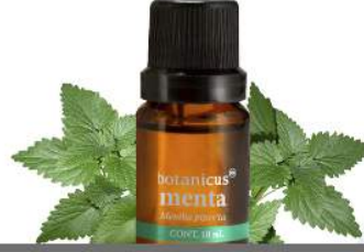
ACEITE ESENCIAL MENTA

Excelente contra la fatiga mental, refresca el espíritu y mejora la concentración.