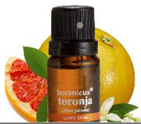
ACEITE ESENCIAL TORONJA

Calma el estrés y ansiedad, reaviva la mente, estimula el sistema digestivo.