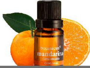
ACEITE ESENCIAL MANDARINA

Antiestrés, su aroma estimula la creatividad, es calmante y relajante.