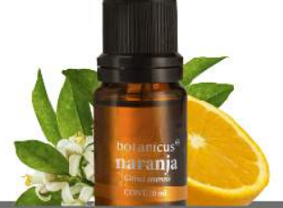
ACEITE ESENCIAL NARANJA

Estimula el estado de ánimo envolviéndonos con su fresco y dulce aroma.