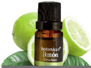
ACEITE ESENCIAL LIMÓN

Tiene una acción antiséptica, ayuda a mitigar algunas afecciones relacionadas con el sistema respiratorio.