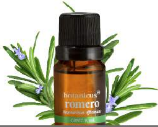
ACEITE ESENCIAL ROMERO

Ayuda a re confortar enfermedades respiratorias como asma y bronquitis.