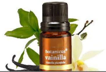
ACEITE ESENCIAL VAINILLA

Aroma que brinda un abrazo cálido que nos conecta a momentos felices de la infancia.